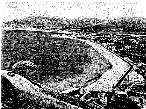
(Benidorm. Año 1956).

(Valoración total: hasta 1,5 puntos; 0,50 puntos por cada apartado).