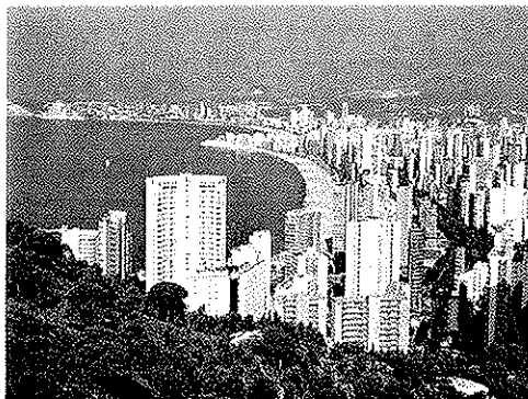
(Benidorm. Año 2008).

a) Comente las diferencias que aprecia en ellas.